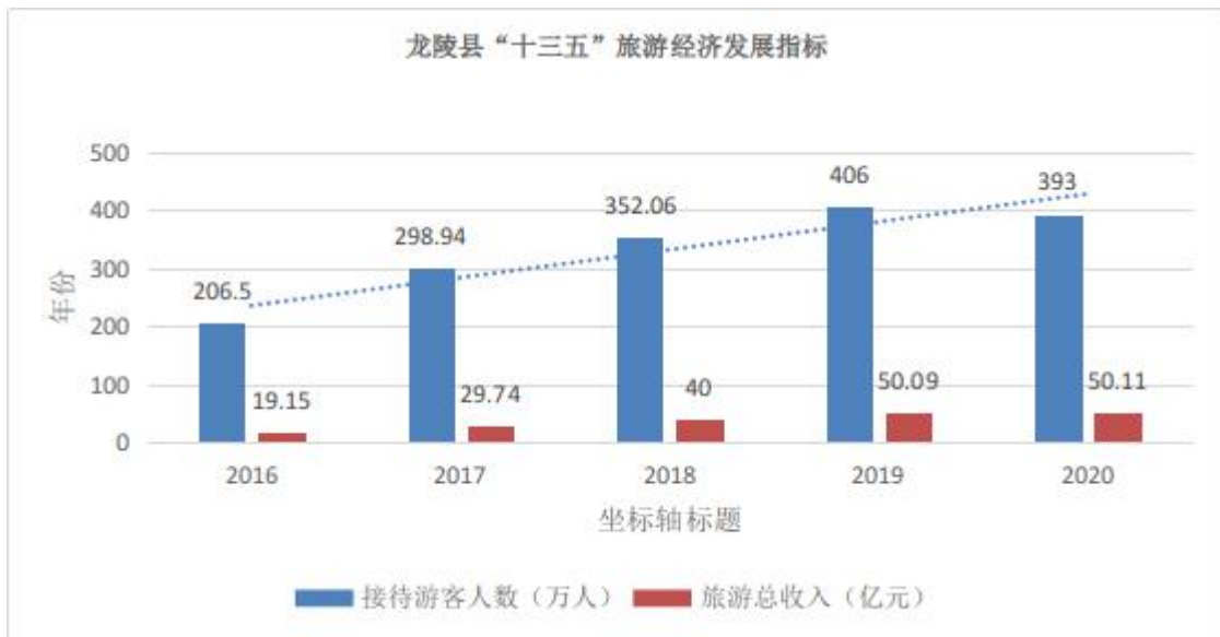
图 1：龙陵县“十三五”旅游经济发展指标统计柱状图