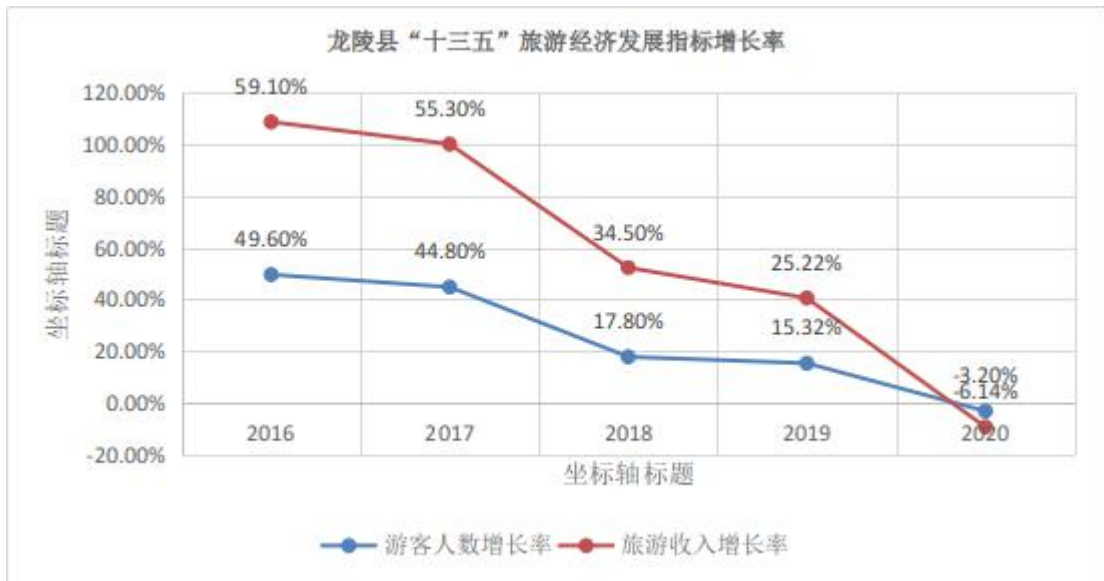
图 2：龙陵县“十三五”旅游经济发展指标增长率折线图

通过分析可见，“十三五”期间，龙陵县旅游接待人次、旅游总收入和旅游人均消费等方面均呈快速增长态势。2020年，受新冠肺炎疫情影响游客量及旅游收入出现负增长。